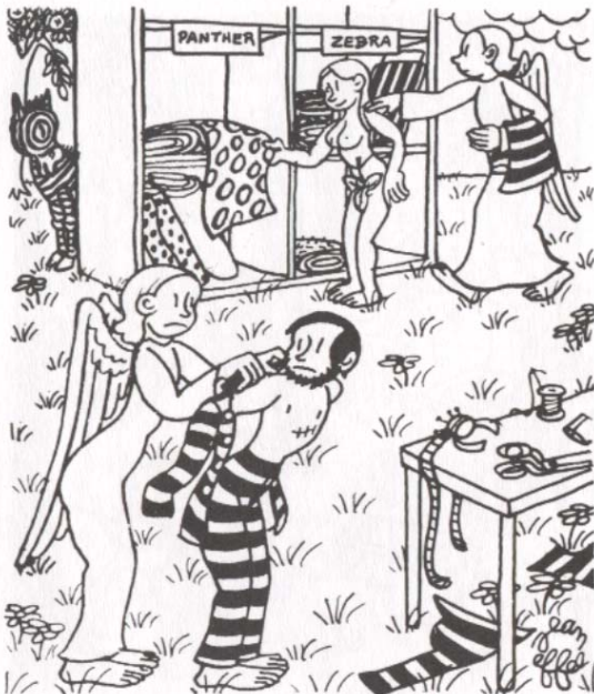
«Nein, nein, auch Sie müssen jetzt Zebrastrreifen tragen!»