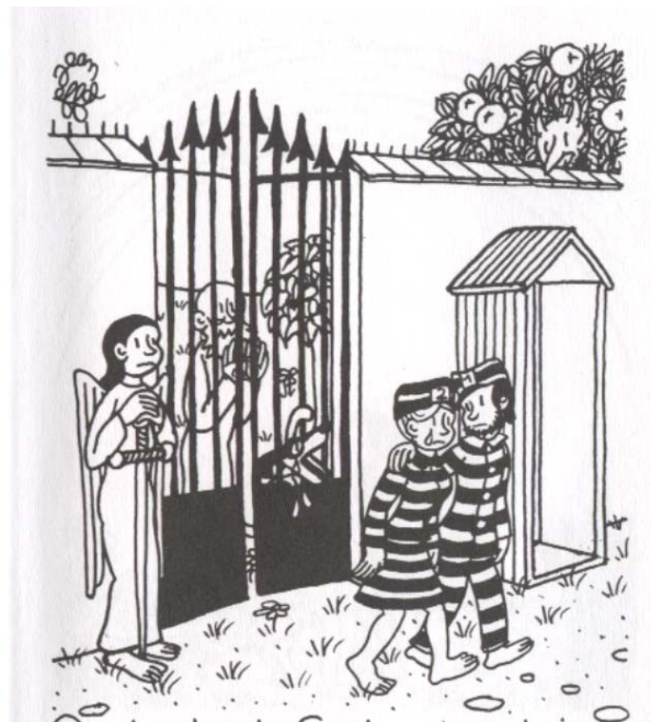
Zu ewiger Zwangsarbeit verurteilt